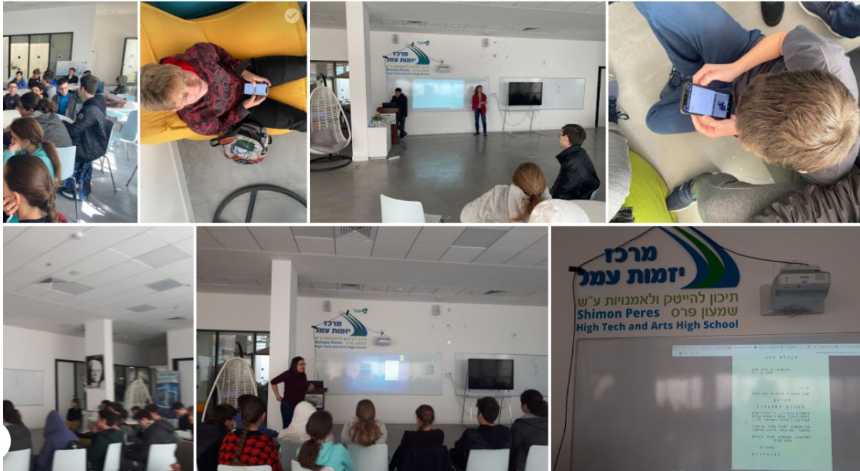
שיעורי היסטוריה ואזרחות עם מומחי תוכן בית ספריים, פעילות מקוונת בסלולר, אלבום תמונות נוספות